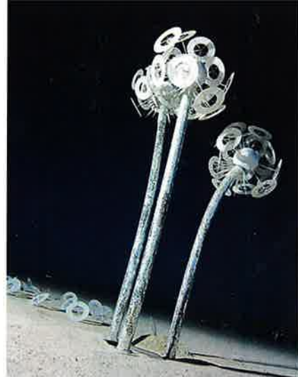
Man undres over, hvordan kunstnerne har formået at transportere deres enorme skulpturer ud i ørkenen.